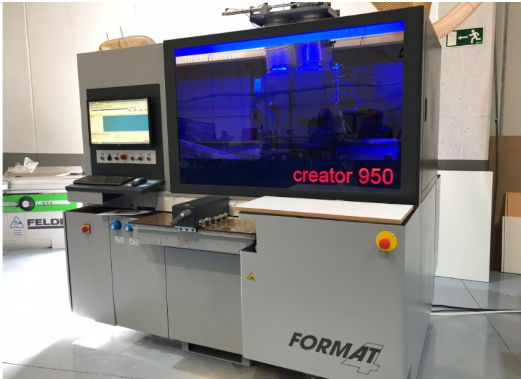
El nuevo show-room de Felder en Barberà del Vallès (Barcelona) cuenta con el premiado modelo Creator 950.